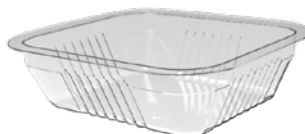
BT 325 S