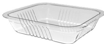
BT 220 S