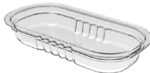
BT 56 S