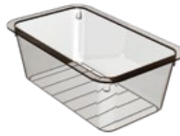
BT 380 S